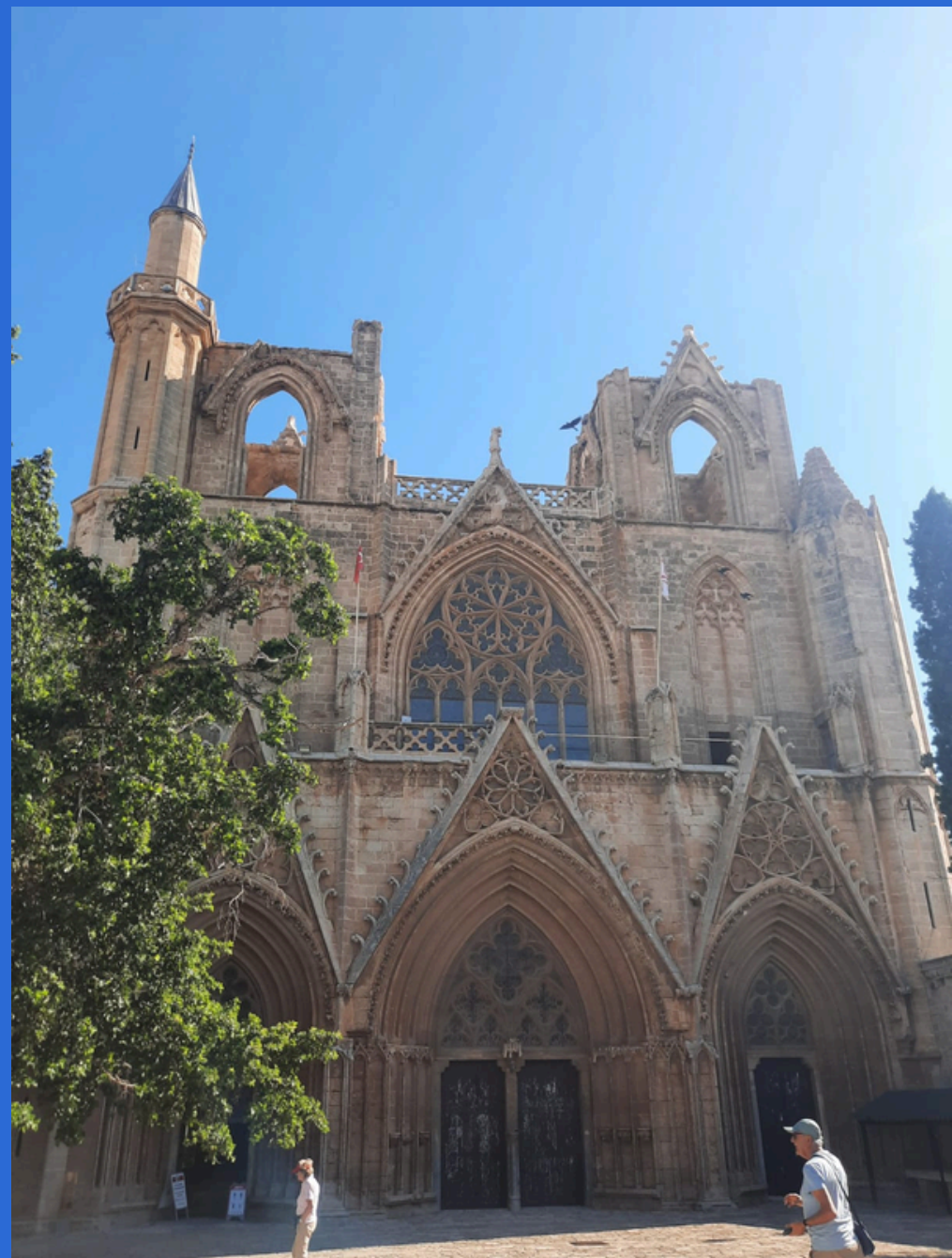
Cattedrale di S. Nicola, trasformata in Moschea

Situata nella parte Turca dell'Isola, è una città ricca di storia risalente al III sec. a.C.