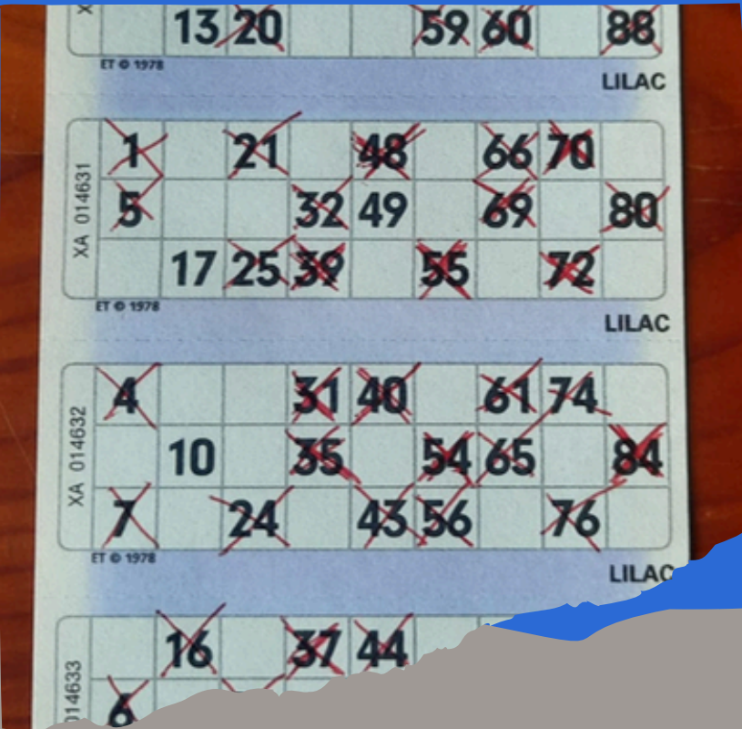
TOMBOLA DEI NUMERI