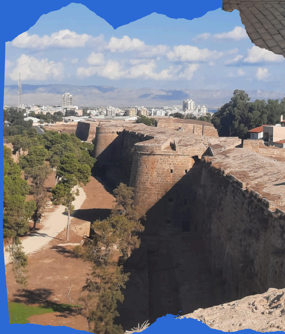
Antiche mura veneziane